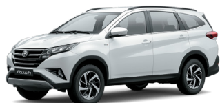
(1E7) Argent M.M.