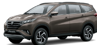
(4T3) Bronze M.M.