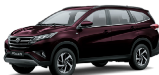
(R54) Rouge Aubergine