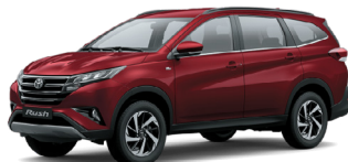
(3Q3) Rouge Bordeaux