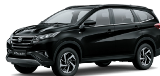
(202) Noir Métallisé